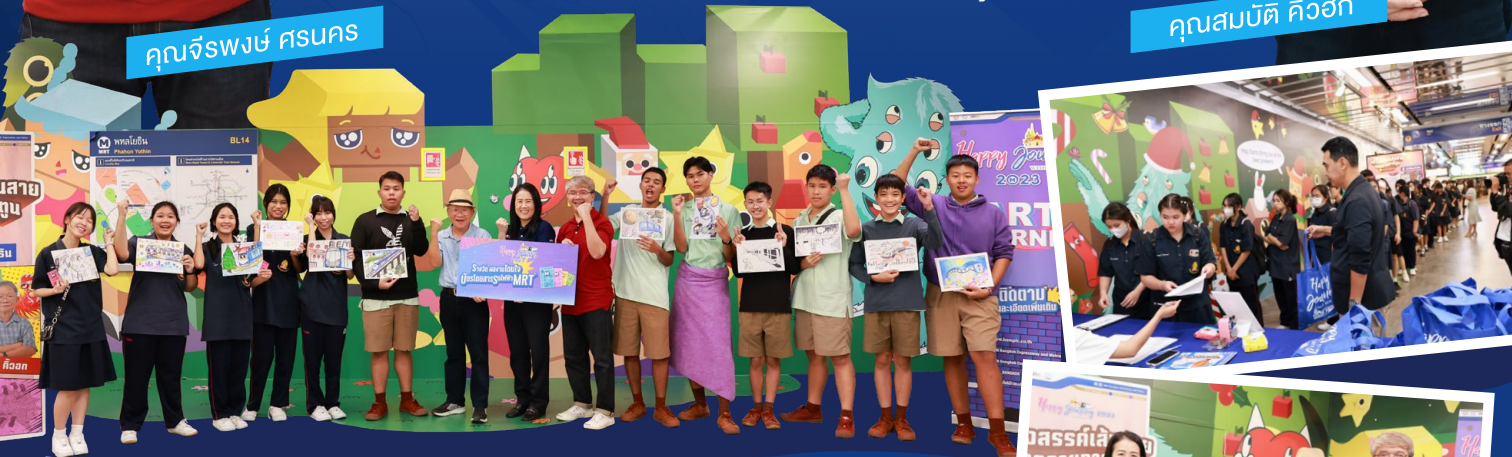
คุณสมบัติ คิ้วสก