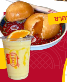
ซาลาเปาลาวา

ตัก หลัก เกี้ย หรือ Talakkia Boutique Hotel เป็นโรงแรมในเครือ Loftel Group ซึ่งยังมีอีก 4 แห่ง ล้วน อยู่ในละแวกเดียวกัน คอนเซ็ปต์คล้ายกัน คือดึงเอาความโดดเด่นของอัตลักษณ์ ชุมชนมาถ่ายทอดเป็น เรื่องราวผ่านโรงแรมที่พัก ไม่ว่าจะเป็น Loftel 22 Hostel, Loftel Station Four Sisters Homestay และ Taladnoi Paint House