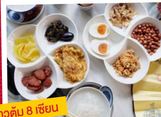
ข้าวต้ม 8 เซียน

ตรุษจีนปีนี้แหล่งท่องเที่ยวที่เป็นชุมชนชาวจีนดูจะคึกคักเป็นพิเศษ อย่างตลาดน้อย หรือ ตัก หลัก เกี้ย ที่กลับมาบ๊อบอีกครั้้งด้วย ร้านรวง คาเฟ่เก๋ๆ ชิคๆ ที่เกิดขึ้นมากมาย โฉมหน้าสไตล์ของคนยุคใหม่ สอดประสานกับวิถีชีวิตไทย-จีนของชุมชนเก่าที่ถูกชุบชีวิตให้มีสีสันอีกครั้ง