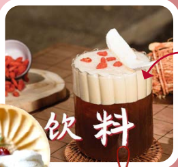
หวังอิงเลี้ยว

ตรุษจีนนี้อย่าลืมแต่งตัวสวยๆ มา จับเครื่องดื่มเย็นๆ หามุมถ่ายรูปชิคๆ เก็บเป็นคอนเทนต์สุดประทับใจเริ่มต้นปี ส่วนใครที่สนใจเวิร์กช็อปเก๋ๆ อย่าง เขียนพู่กันจีนอักษรโบราณ หรือศิลปะ วาดภาพพู่กันจีนผ่นหมึก และตราปั้ม และอื่นๆ อีกมากมายก็ต้องติดตาม เพจของทางร้านว่าจะมีอะไรมาแนะนำ ให้เข้ากับเทศกาลบ้าง