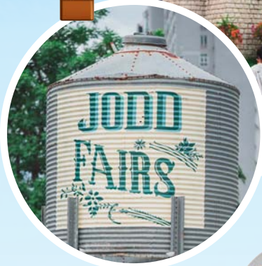
ยำแซลมอนกุ้งสุกไข่แดงเค็ม-จอบที่ย่า

ไปกันหรือยัง ? ตลาดกลางคืนสุดปังแห่งใหม่