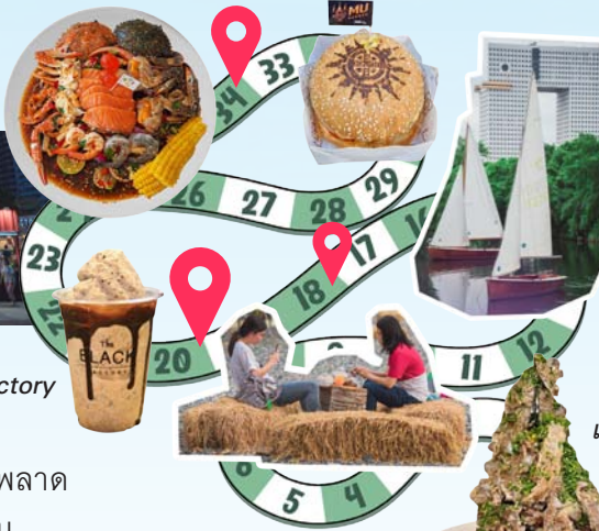
เบอร์เกอร์ตัวกลิ้ง-นครมูเบอร์เกอร์

แบบจุกๆ โดยเฉพาะสตรีทฟู้ด กุ้ง หอย ปู ปลา ร้านหมึกย่างซีดๆ นอกจากนี้จะเป็นแหล่งรวมเมนูสุดจึ้งแล้ว ยังมีมุมซึ้งๆ ให้สายสวีตตรงด้านหลังของตลาดที่มีคอลลิจเล็กๆ พร้อมเรือใบลำน้อยล่องลอยให้ถ่ายรูป แดมมองไปไกลๆ ยังเห็นวิวตึกข้างอีกด้วย