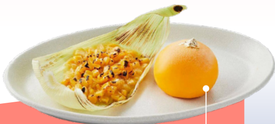
ทิพย์รสไข่แข็ง ๒๕๖๓ ทำนานแบบที่ใหม่ กับไข่แข็งเคลือบน้อไอศกรีม พร้อมทูปข้าวโพดอบโรนไฟ

“คอนเซปต์ในการรีแบรนด์ก็คืออยากให้ทิพย์รสไปนั่งอยู่ในใจคนรุ่นใหม่ได้มากขึ้นค่ะ ก็เลยเป็นที่มาของ ทิพย์รส อเมซิ่งเมนู จับเอาไอศกรีมมากินกับเครื่องเคียงไทยต่างๆ อย่างขนมไทยให้คนไทยได้รู้จักมากขึ้น เมนูจะถูกพัฒนาคิดค้นขึ้นมาอีกชั้นหนึ่ง ว่าไอศกรีมรสนี้ควรกินกับขนมโบราณชนิดไหนถึงจะเข้ากัน ส่วนเมนูดั้งเดิมอย่างไอศกรีมไข่แข็งเราก็ประยุกต์มาเป็นอีกเมนู เรียกว่า ไข่แข็ง ๒๕๖๓ นำเอาไข่แดงไปตีกับไอศกรีม คลายเป็นไข่เคลือบแทนการมาทังใบก็ทำให้กินง่ายมากขึ้น รูปลักษณ์สวยขึ้น เหมาะกับน้องๆ วัยรุ่นมากขึ้นค่ะ”