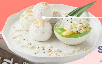
กะทิรวมมิตร